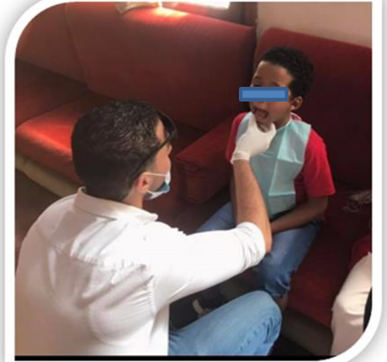
الزيارة الميدانية الى دار الايتام