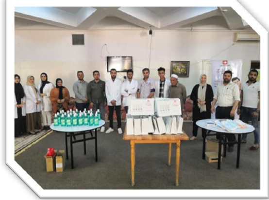
الزيارة الميدانية لدار الوفاء المسنين