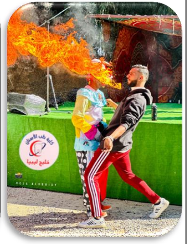
السوق الخيري " لأجلك " وإيراده يرجع لمرضى السرطان