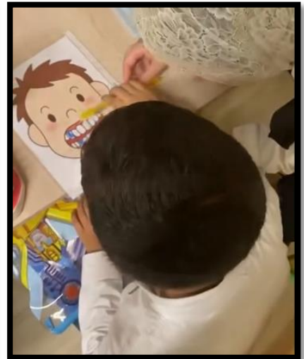
الزيارة الميدانية لمركز "عالمي الخاص للتأهيل" لأطفال ذوي الاحتياجات الخاصة