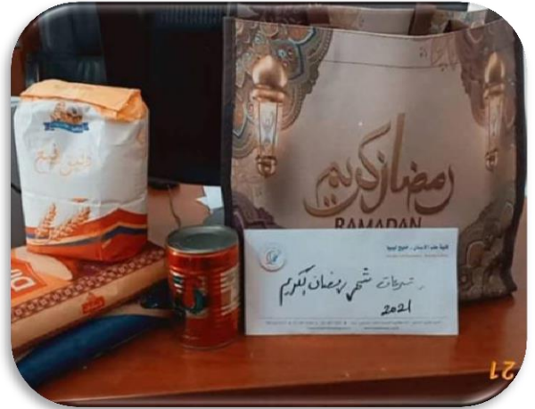
الحملة الخيرية السنوية "قفة رمضان"